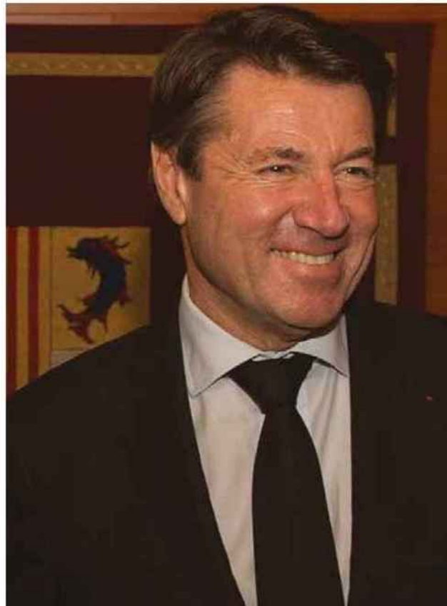
Christian Estrosi, président de la Métropole Nice Côte d'Azur

En effet et à titre d'exemple, faire un plein de gasoil maritime en Italie pour un yacht de 42 mètres permet d'économiser près de 21 000 euros par semaine en raison du différentiel de taxes tandis que le surcoût annuel en France lié aux charges sociales s'élève à 300 000