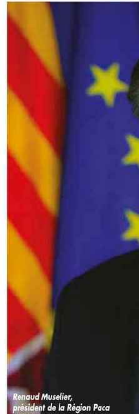
Renaud Muselier, président de la Région Paca