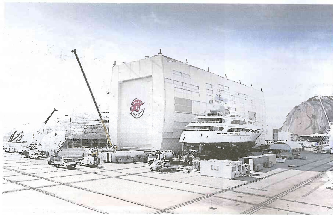
Monaco marine a réalisé en 2019 un chiffre d'affaires d'environ 70 millions d'euros.

Le secteur des méga-yachts, est « un marché d'avenir », rappelle-t-il tout en précisant que Monaco marine accueille sur ses sites 10 % de la flotte mondiale, et s'occupe, en Méditerranée, du refit d'un yacht