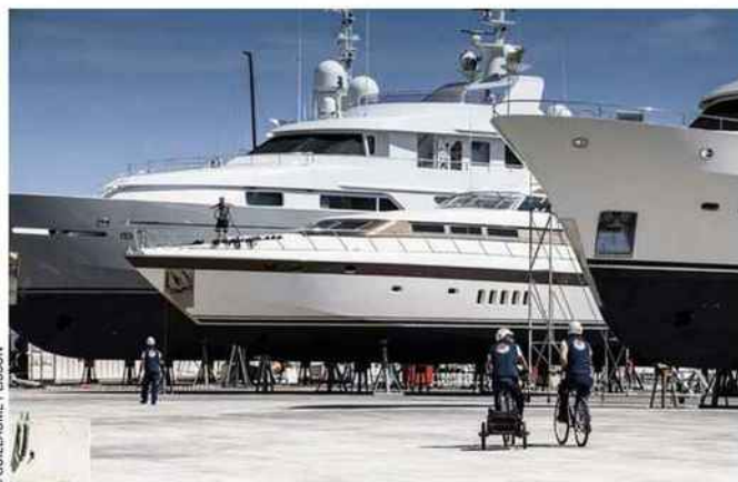
Monaco Marine traite chaque année plus de 3 000 yachts.

de retombées industrielles et touristiques. Selon le cluster RYN, il y a aujourd'hui trois fois plus de yachts qu'en 1990 et, d'ici à dix ans, le volume d'activités liées à la maintenance et la réparation de ces grandes unités aura doublé.