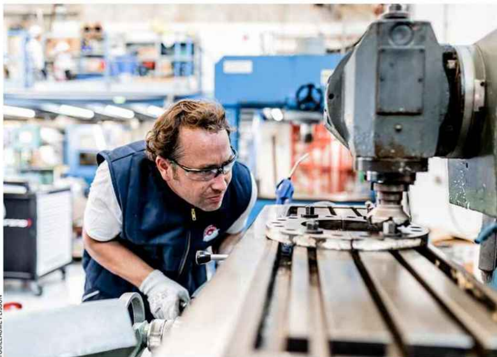
60 personnes travaillent sur le site de La Ciotat.

une année entière. « C'est un peu comme si quelqu'un arrivait avec son matelas dans votre salon et s'installait pour six mois en attendant que les travaux de votre appartement soient terminés. Nous sommes leur hôte, nous devons faire en sorte qu'ils se sentent à l'aise, écoutés par du personnel attiré, en sécurité. C'est un métier sur-mesure. Si on a des opportunités de carrière ou d'évolution, c'est grâce aux clients, pas grâce